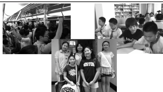
在上海，我们 早上上课，下午到上海市玩， 晚上去Host Family 家睡觉。